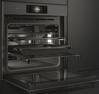
ZX6685M Pyrolyse oven (nis 60 cm)