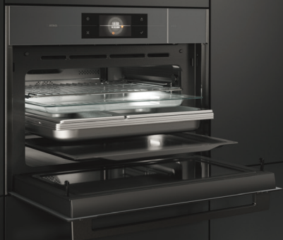
CSX4685M 3-in-1 oven (nis 45 cm)