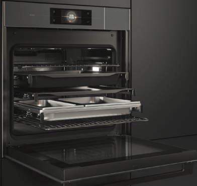
CS6585M1C Combi-stoomoven (nis 60 cm)