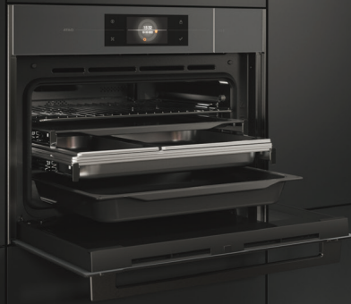
CS4585M1C Combi-stoomoven (nis 45 cm)