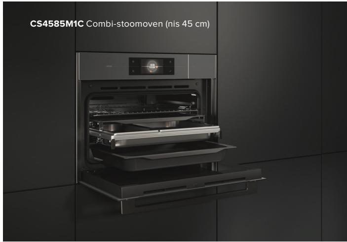
CS4585M1C Combi-stoomoven (nis 45 cm)