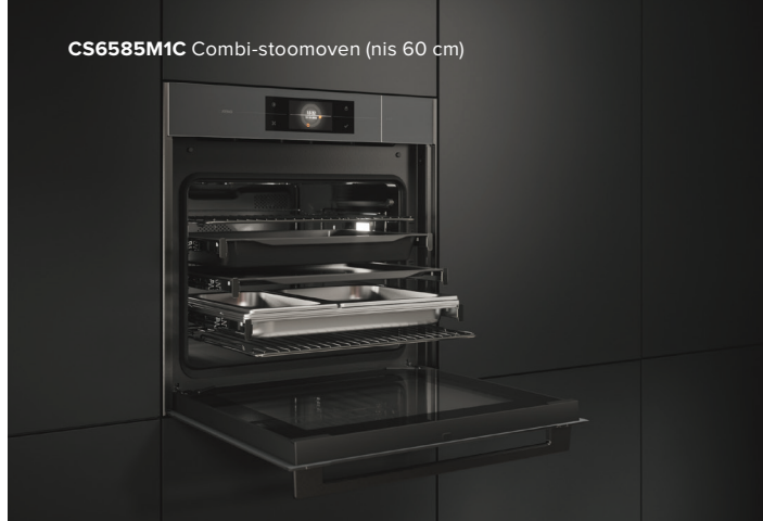
CS6585M1C Combi-stoomoven (nis 60 cm)