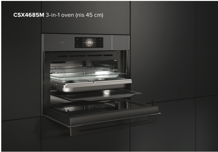
CSX4685M 3-in-1 oven (nis 45 cm)