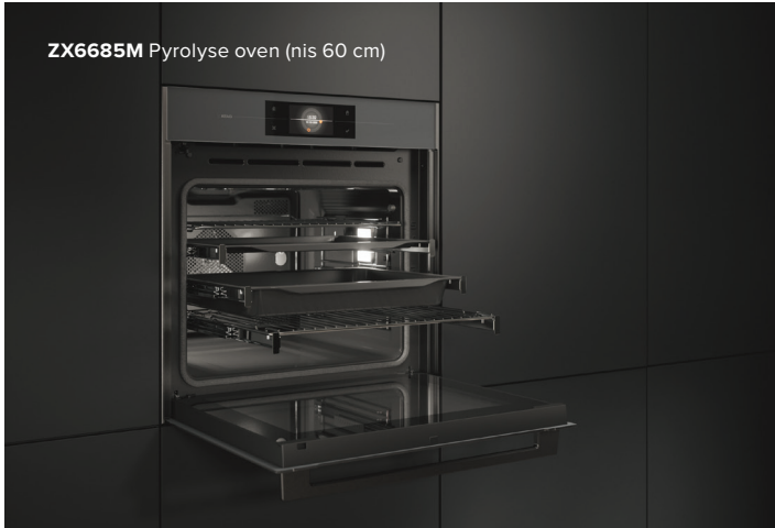
ZX6685M Pyrolyse oven (nis 60 cm)